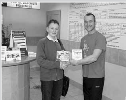
Wręczenie nagrody w zawodach pływackich

Ogólnie, podczas tegorocznej akcji w Dzielnicy Wesola z „Punktów dziennego pobytu” skorzystało 600 dzieci (odnotowano 3 188 „osobowejść”). W placówkach prowadzących „Zajęcia specjalistyczne” dzieci i młodzież wzięły udział 2 834 razy (osobowejścia).