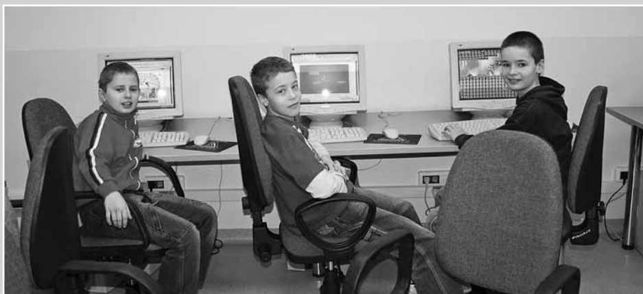
Zajęcia świetlicowe i informatyczne w SP Nr 174

Podobną funkcję pełniły tak zwane „Punkty zajęć specjalistycznych”, organizowane w gimnazjach (Gimnazjum Nr 119 i Gimnazjum Nr 120) oraz w Ośrodku Kultury i Bibliotece Publicznej.