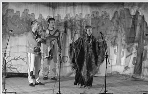
Spektakl „Trzy białe strzały”

W sali kinowej Klubu Garnizonowego „Kościuszkowiec” dwa razy w tygodniu odbywały się seanse filmowe dla dzieci (Auta, Garfield 2, Epoka lodowcowa 2, Dżungla), wystawiany był także spektakl teatralny dla dzieci – baśń indiańska p.t. „Trzy białe strzały”. Wstęp na filmy i spektakl był oczywiście bezpłatny.