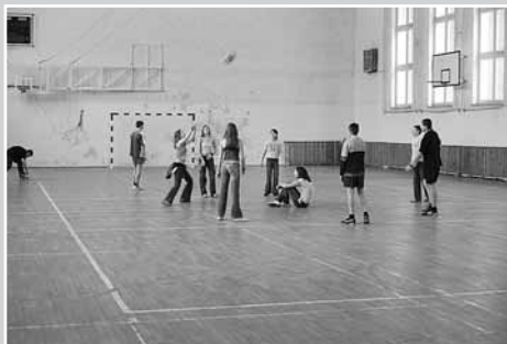
Zajęcia sportowe w Gimnazjum Nr 119 i SP Nr 174

Placówki organizowały wycieczki po Warszawie oraz wyjazdy do teatrów (Lalka, Guliwer) i do ZOO. Uczestnicy akcji mogli korzystać w grupach zorganizowanych z bezpłatnych przejazdów komunikacją miejską, w tym także SKM.