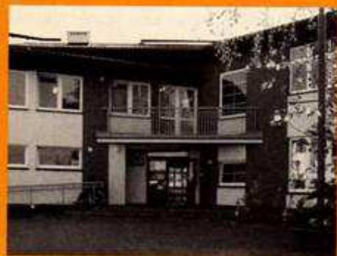
Wejście do nowej części budynku Gimnazjum Nr 119

Uprzejmie informujemy, że wszystkie aktualne rozkłady jazdy autobusów komunikacji miejskiej dostępne są na stronach internetowych www.ztm.waw.pl