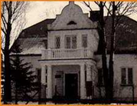
Nowa siedziba OPS i DBFO.

Rok 2004 był drugim rokiem dostosowywania samorządów dzielnic warszawskich do struktur miasta stołecznego.