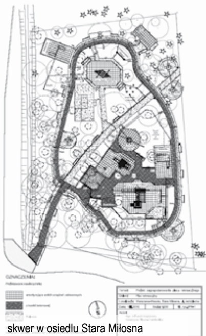
skwer w osiedlu Stara Miłosna