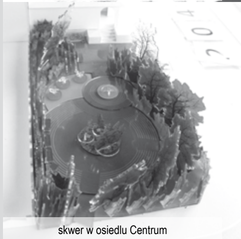
skwer w osiedlu Centrum

Na przełomie września i października bieżącego roku Zarząd Dzielnicy Wesoła we współpracy z Centrum Komunikacji Społecznej Urzędu m.st. Warszawy zorganizował trzy spotkania konsultacyjne z mieszkańcami, których tematem było „Urządzenie skwerów osiedlowych” na terenie Dzielnicy Wesoła. W tym celu przygotowane zostały makiety przedstawiające miejsca planowanych zmian i jego otoczenia wraz z elementami ruchomymi, które mieszkańcy mogli przestawiać lub zastępować innymi częściami.